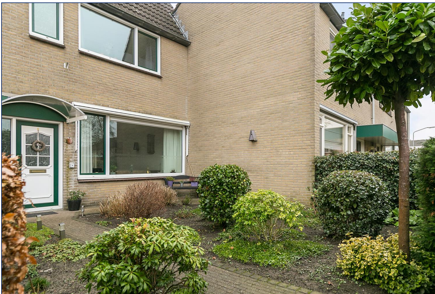
Vierhoven 21 4844 VA Terheijden