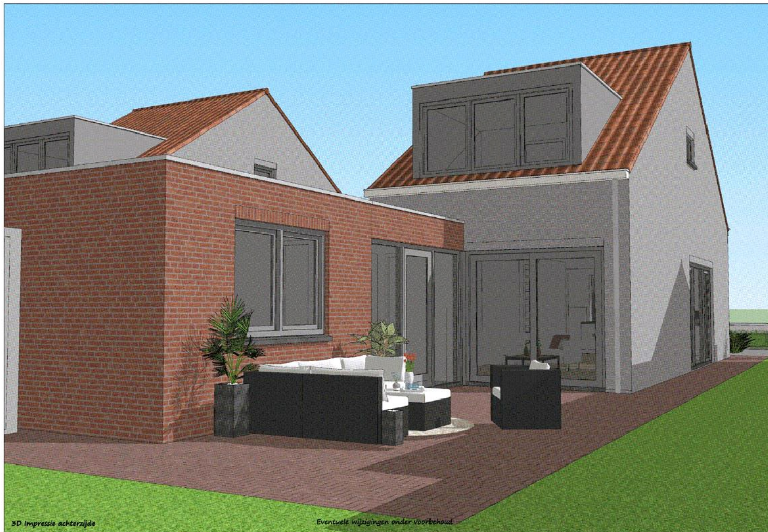
3D impressie achterzijde