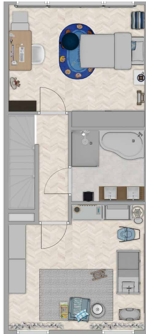
Type D - 2e verdieping