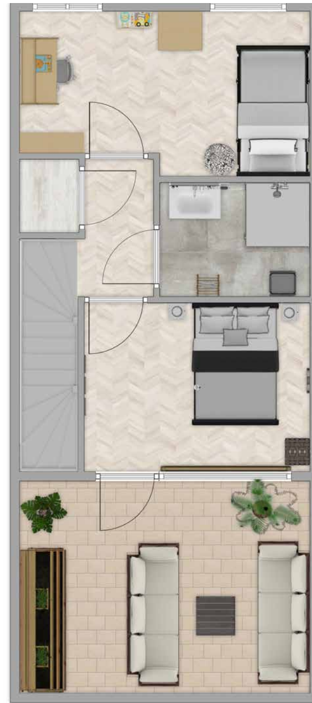
Type D - 3e verdieping