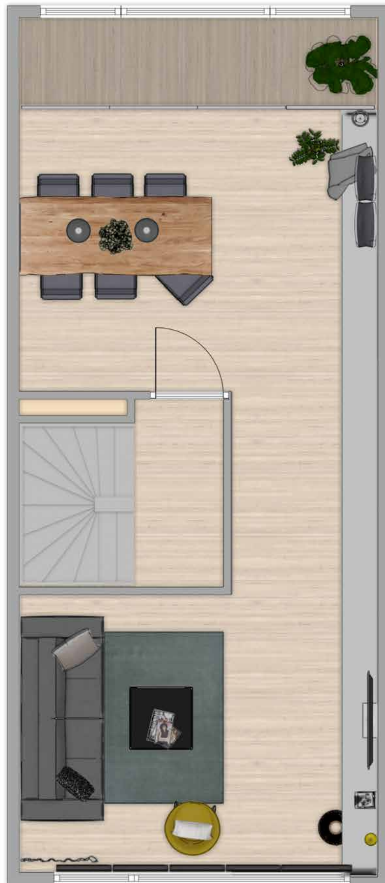
TYPE F SP. 1 E VERDIEPING