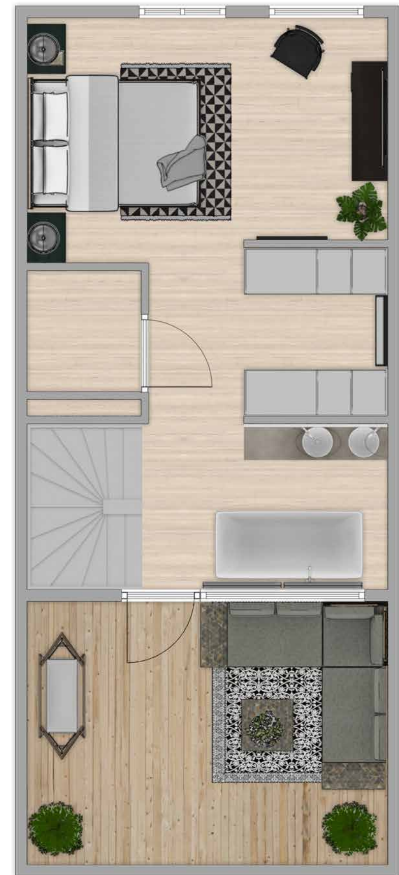
TYPE F SP. 3 E VERDIEPING

Een walk-in closet, een halfopen badkamer met vrijstaand bad, een kingsize bed, een sfeervol dakterras en een fantastisch uitzicht over de polder en de schepen op de Gouwe vanaf de 4e verdieping. Volgens ons maken deze ingrediënten deze slaapverdieping wel heel bijzonder. Dit is met recht wonen in stijl.