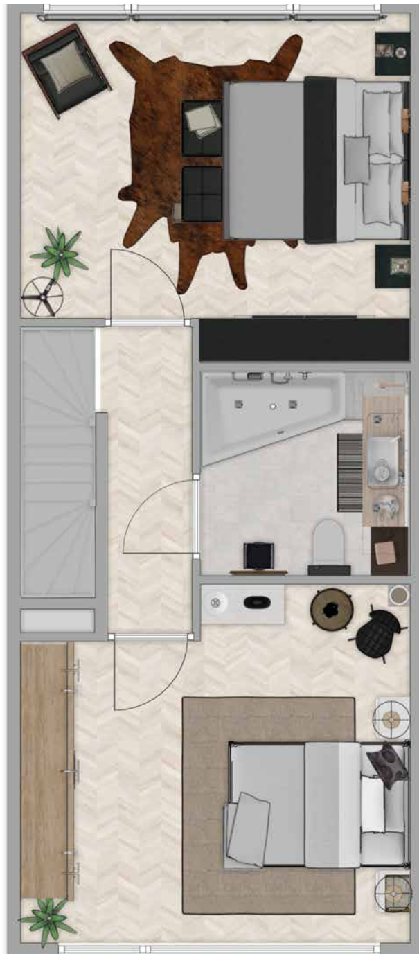
Type D - 1e verdieping

zo'n groot gezin is immers zeldzaam. Maar beschikken over volwaardige badkamers is natuurlijk een ongelooflijke luxe in de ochtendspits voor vetrek naar werk en school, ook in minder grote huishoudens.