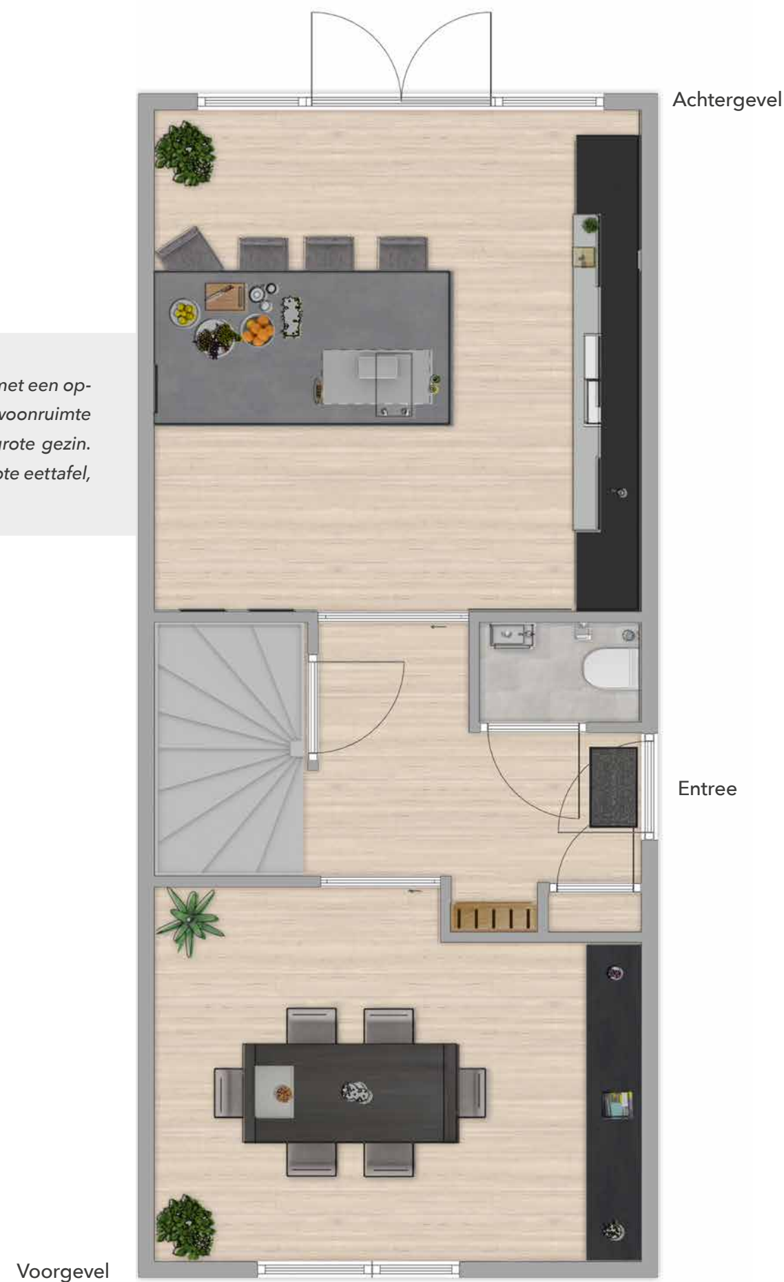
TYPE F SP.