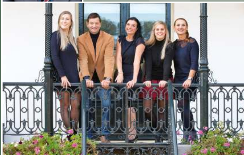
Team Bell Makelaardij B.V.

Adviseur woningmakelaardij ARMT / erkend financieel adviseur